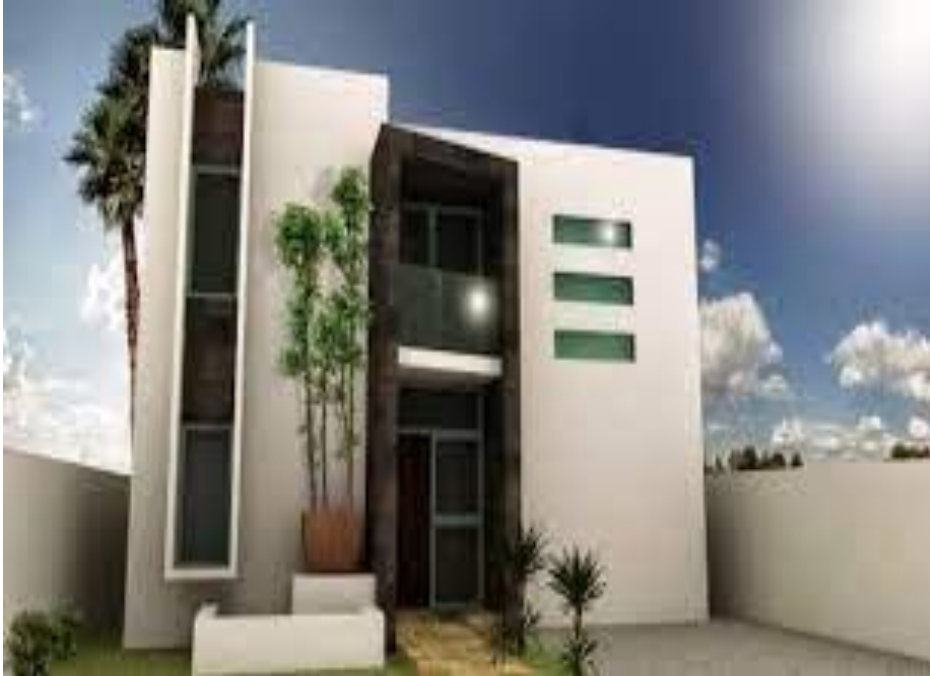
CASA O APARTAMENTO

LAS FOTOGRAFÍAS DEBEN SER TOMADAS DE MANERA HORIZONTAL